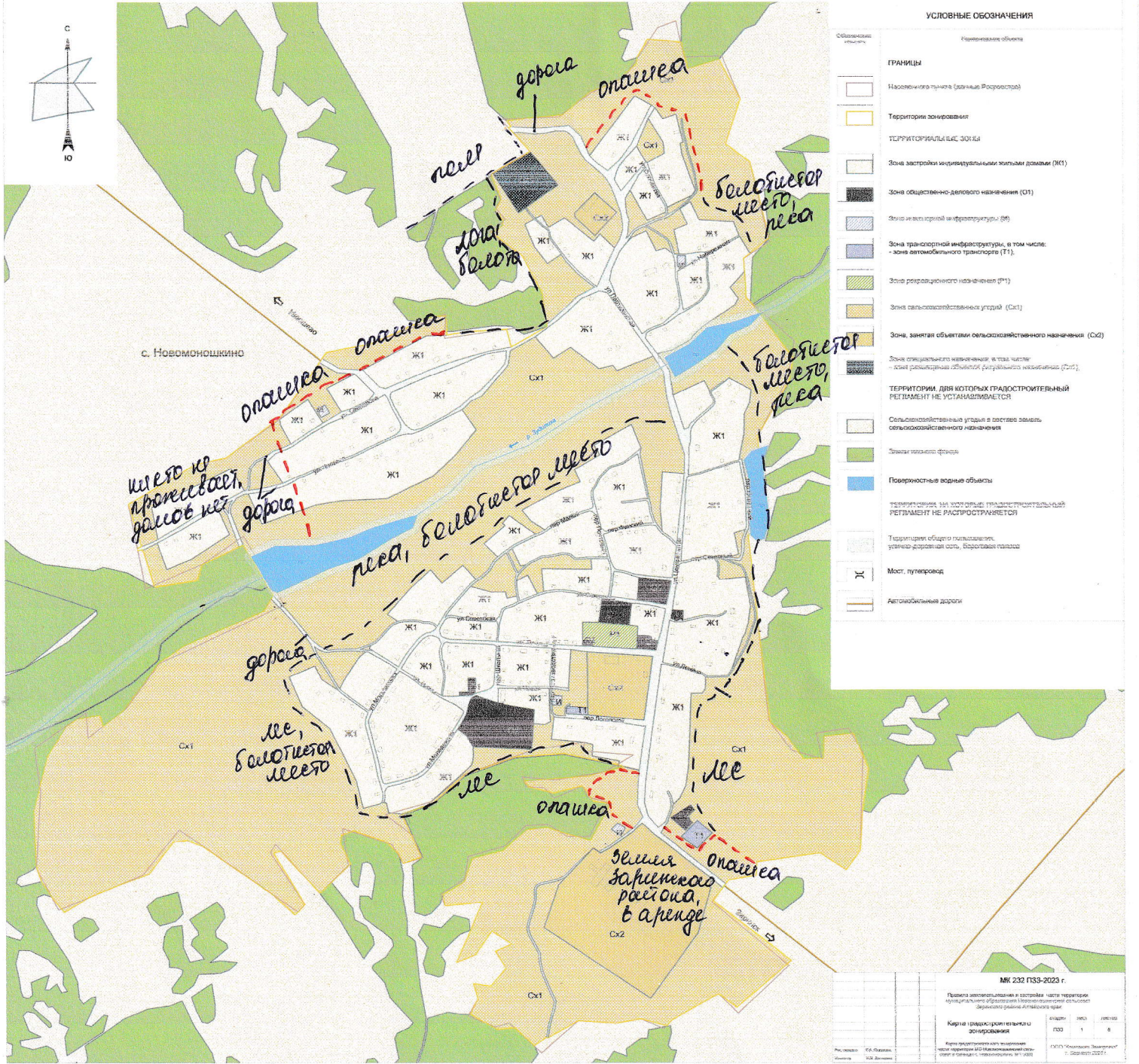
Карта градостроительного зонирования части территории муниципального образования Новоманошкинский сельсовет в границах с. Новоманошкино. М 1:5000