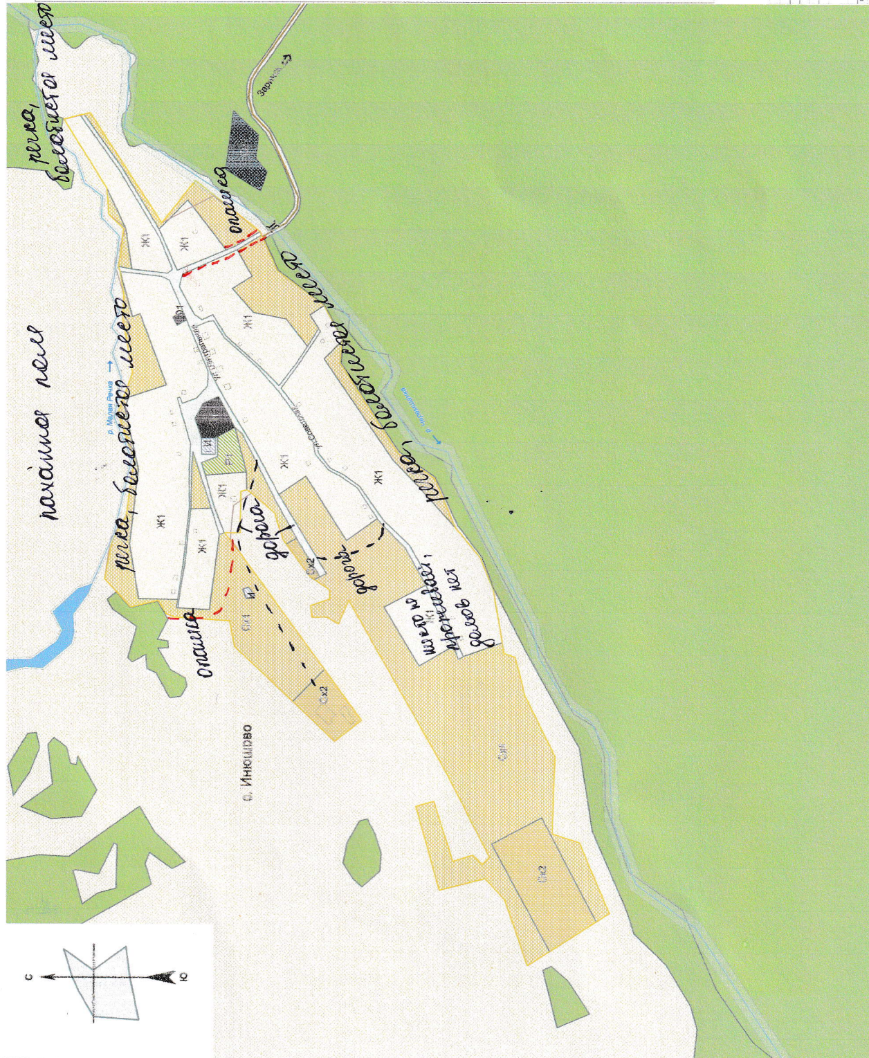
Карта градостроительного зонирования части территории муниципального образования Новомоношхинский сельсовет в границах с. Инюшово. М 1:5000